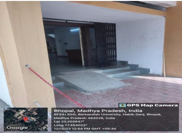
Ramp at Teaching Departments and Library Building