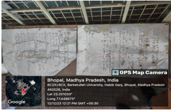
Brail Board at Mitra Karyalaya