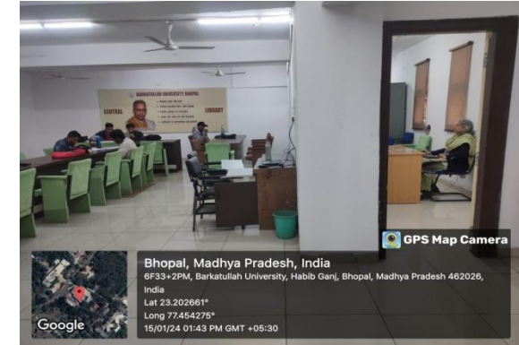
Facilities for Divyangjan at Central Library