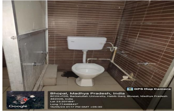
Disabled Friendly Washrooms